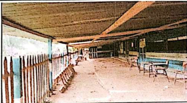
Foto1: SUSTITUCION DE BIGAS POR COSTANERAS Y LAMINAS.