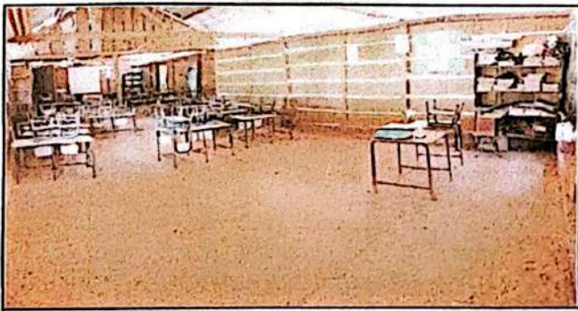
Foto 6: SUSTITUCION DE PAREDES DE MADERA POR BLOCK, CONSTRUCCION DE PISO TIPO ENTORTADO INTERIOR DE AULA.

Observación: Si es necesario se pueden agregar hojas adicionales y actualizar al momento de hojas.